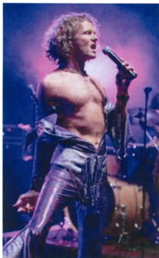
Der Popolski Show begeisterte im Signal Iduna Park.

Dass in der Pop-Welt Schein und Sein oft auseinanderfallen, verstört wohl niemanden mehr.